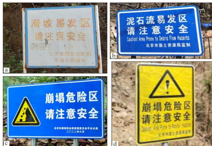
图 5 各区县警示牌样式

由于缺乏统一标准要求，各区、各部门不同时期设立的警示牌材质多样、内容各异、大小不一、色彩不同，树立的位置也有一定的随意性，不能充分地起到警示作用（图 5），亟需进一步统一规范。如平谷区早期为白底红字蓝框（图 5a），后改为蓝底白字白框（图 5b），最近（2022 年）更新的警示牌则是在蓝底白字白框的基础上增加了灾种标志（图 5c）。怀柔、石景山和门头沟等区均使用了的不带灾种标志的蓝底白字白框警示牌（图 5b）。此外，昌平、房山、丰台、海淀、密云、延庆和门头沟等区还使用了黄底黑字黑框加警示标志的警示牌（图 5d）。