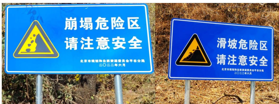
图 4 我市地质灾害警示牌示例

尽管我市在警示牌设立方面已取得一系列成果，但排查过程中也发现了一些问题，主要有以下两个方面：